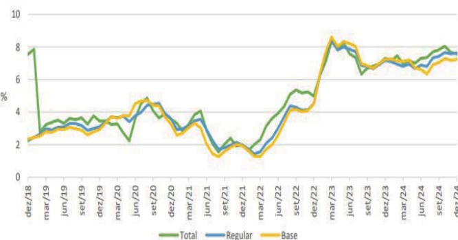
Figura 1 - Variação homóloga da remuneração bruta mensal média por trabalhador (total, regular e base), nos Açores

Nota: A variação expressiva observada em dezembro de 2018 deve-se à diferente forma de pagamento do subsídio de Natal no setor das Administrações Públicas nesse ano (100% em novembro), quando no ano anterior (2017) tinha sido pago 50% em novembro e os restantes 50% em duodécimos.