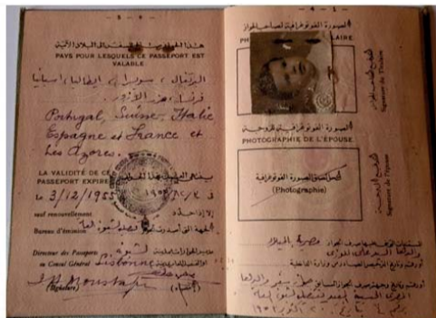
Figura 3: passaporte egípcio, interior, fotografia,1953.