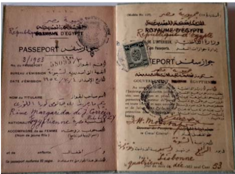
Figura 2: passaporte egípcio, 1953.