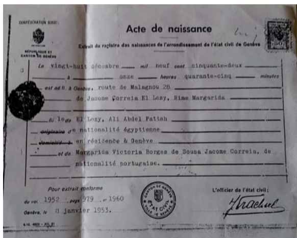
Figura 1: registo de nascimento na Suíça, 1952.

a Lei 2098 de 29-07-1959, era a utilizada quando nasceu: a nacionalidade de criança nascida no estrangeiro não era reconhecida à mãe, era-o apenas a pai português. Ou seja, a Rime e a mãe, por serem mulheres, não tinham direito a ser mãe nem filha. No antes do 25 de Abril o regime via a mulher como um humano secundário; e as crianças, por si próprias, não tinham quaisquer direitos.