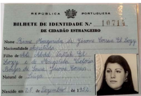
Figura 4: bilhete de identidade de cidadã estrangeira, apátrida, 1973.