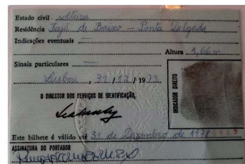
Figura 5: bilhete de identidade de cidadã estrangeira, apátrida,verso, 1973.

inha um bilhete de identidade «de cidadã estrangeira» como«apátrida» «sem nacionalidade»(fig. 4 e 5).