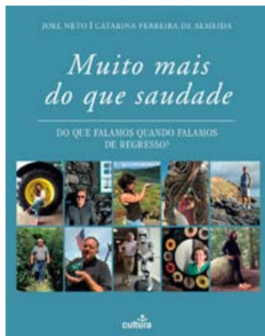
LIVRO “Muito mais do Que Saudade” chega às livrarias em todo país