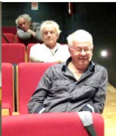
18º GALIZA 2012