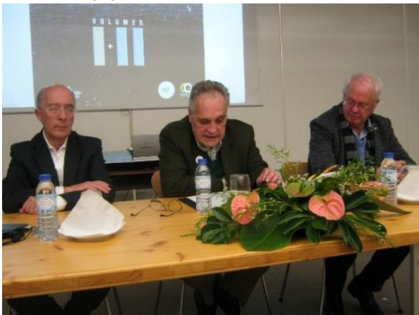
BGA ANGRA 2013