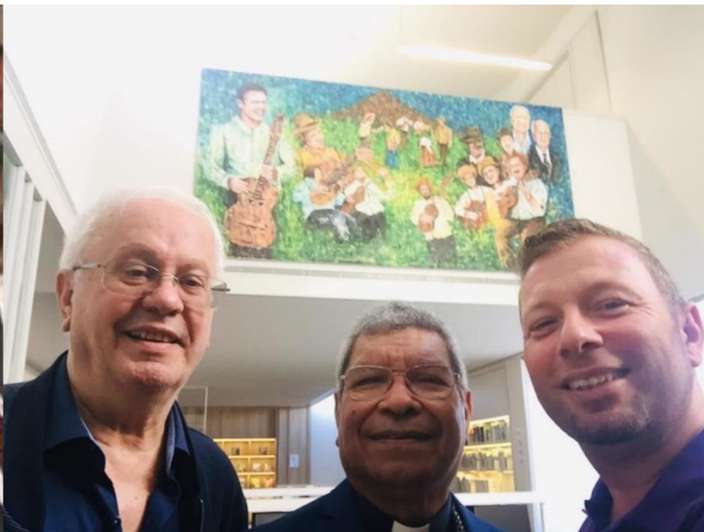
30º PICO 2018