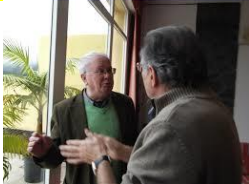
19º MAIA 2013