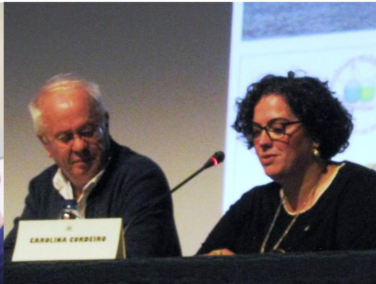
30º PICO 2018