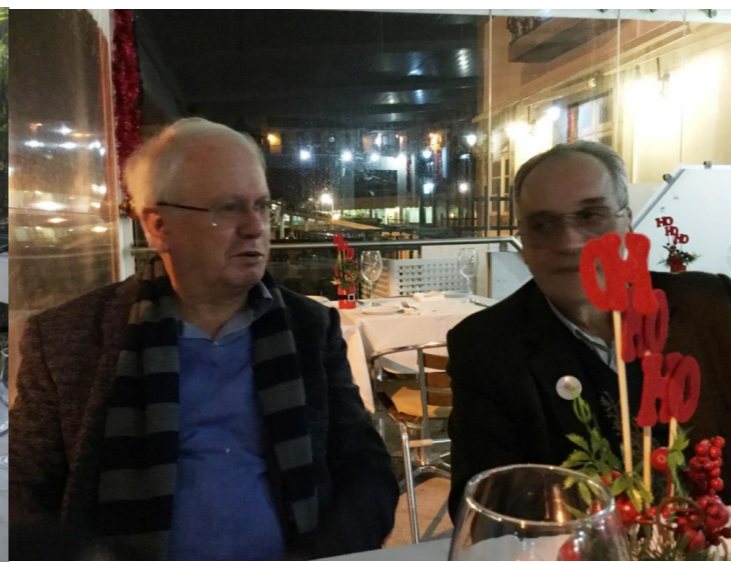
BGA ANGRA 2017