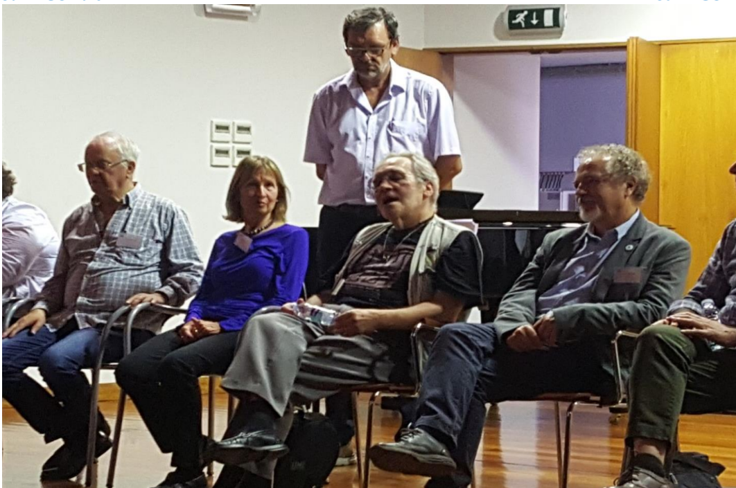
32º GRACIOSA 2019