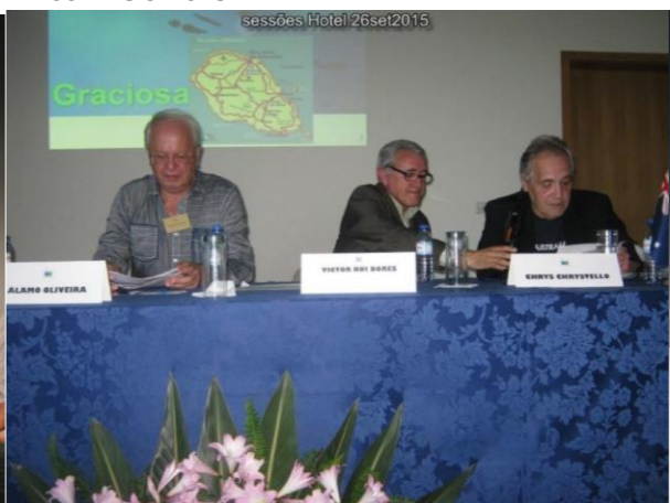
24º GRACIOSA 2015