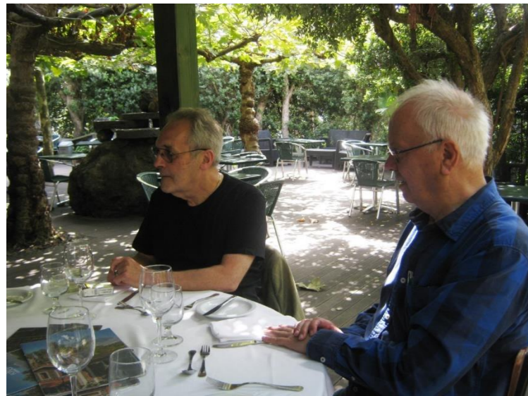
30º PICO 2018