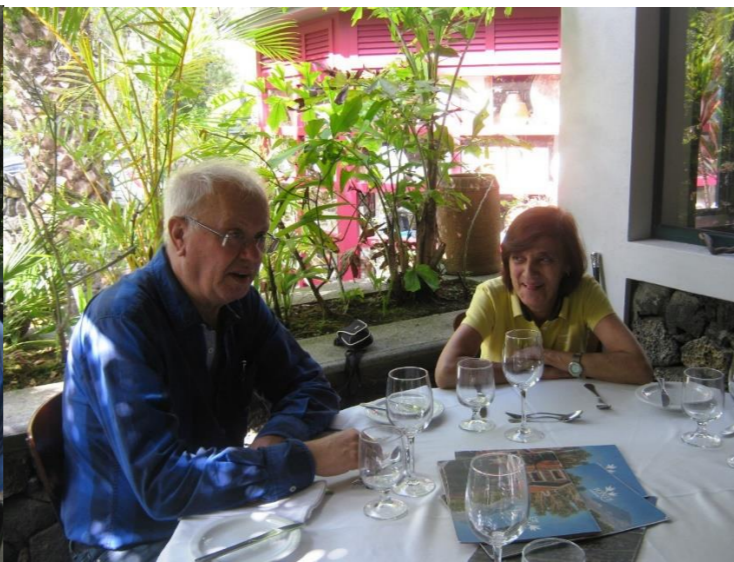
30º PICO 2018