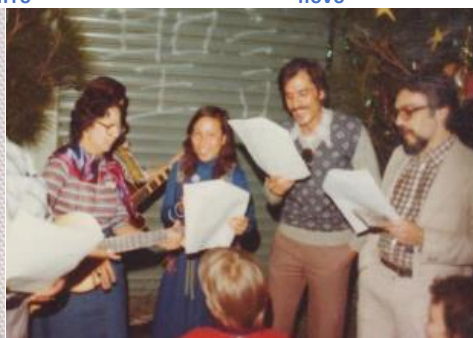
natal 1977 na CEM