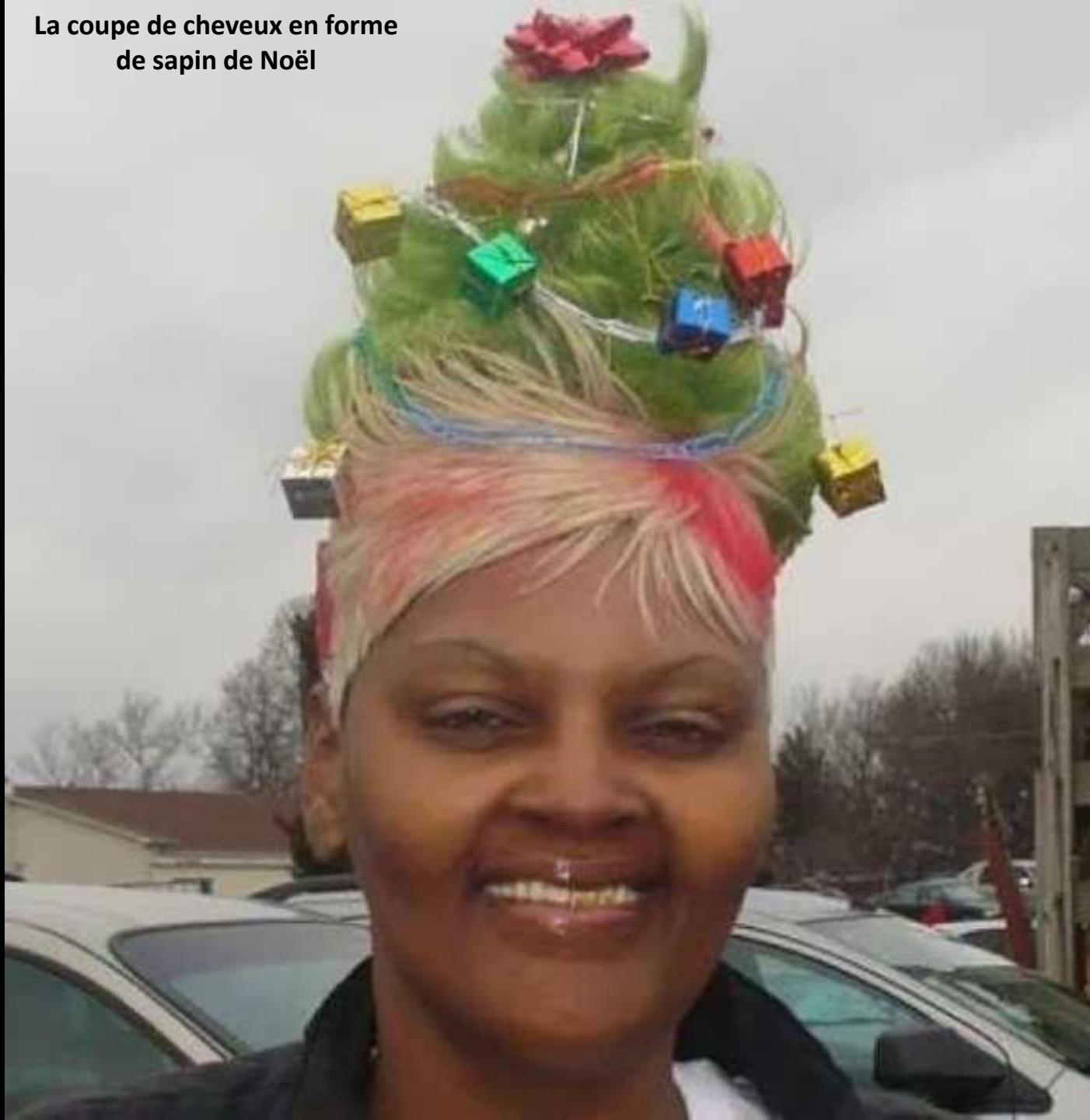
La coupe de cheveux en forme de sapin de Noël