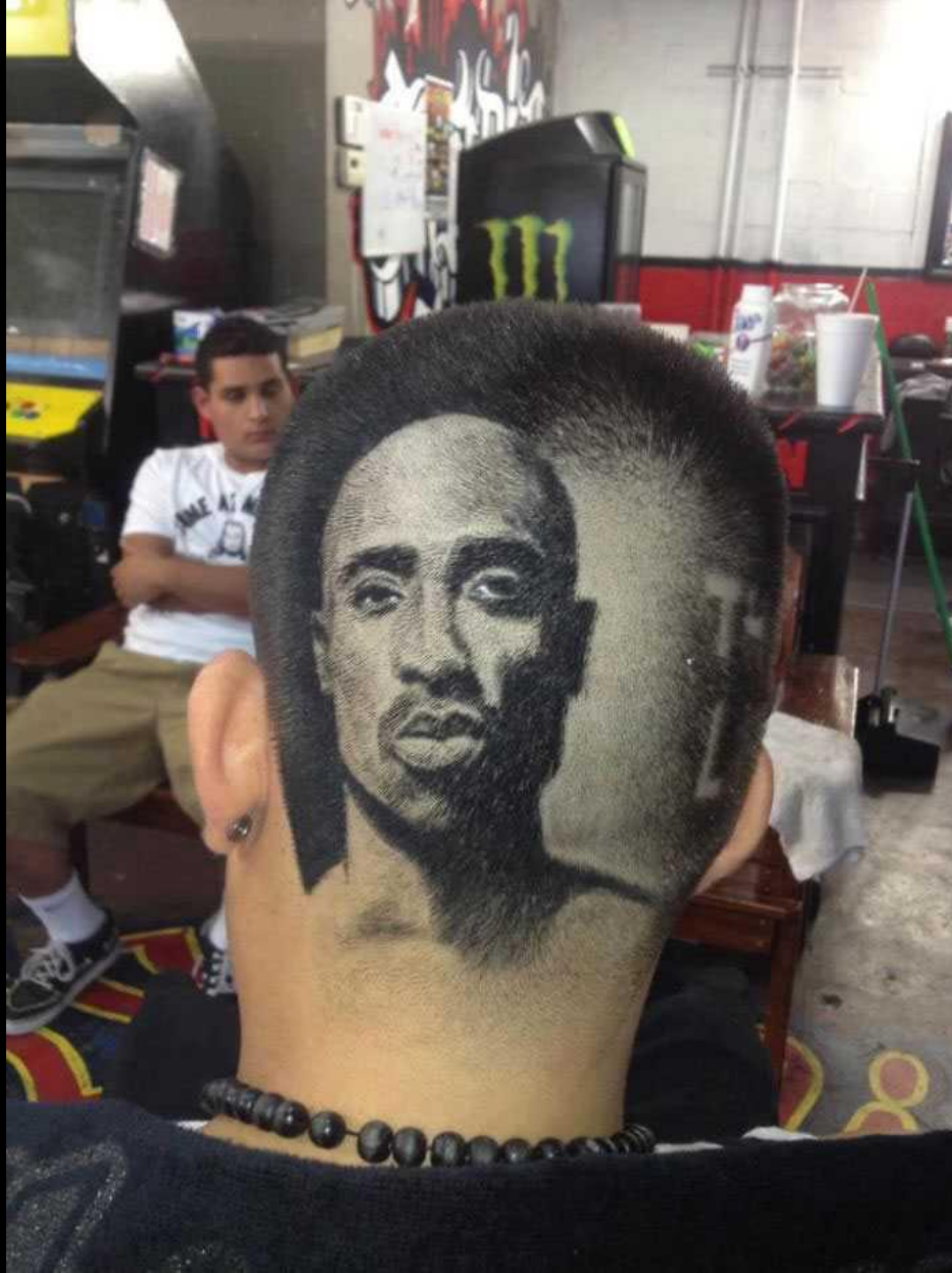
La coupe de cheveux en hommage à Tupac