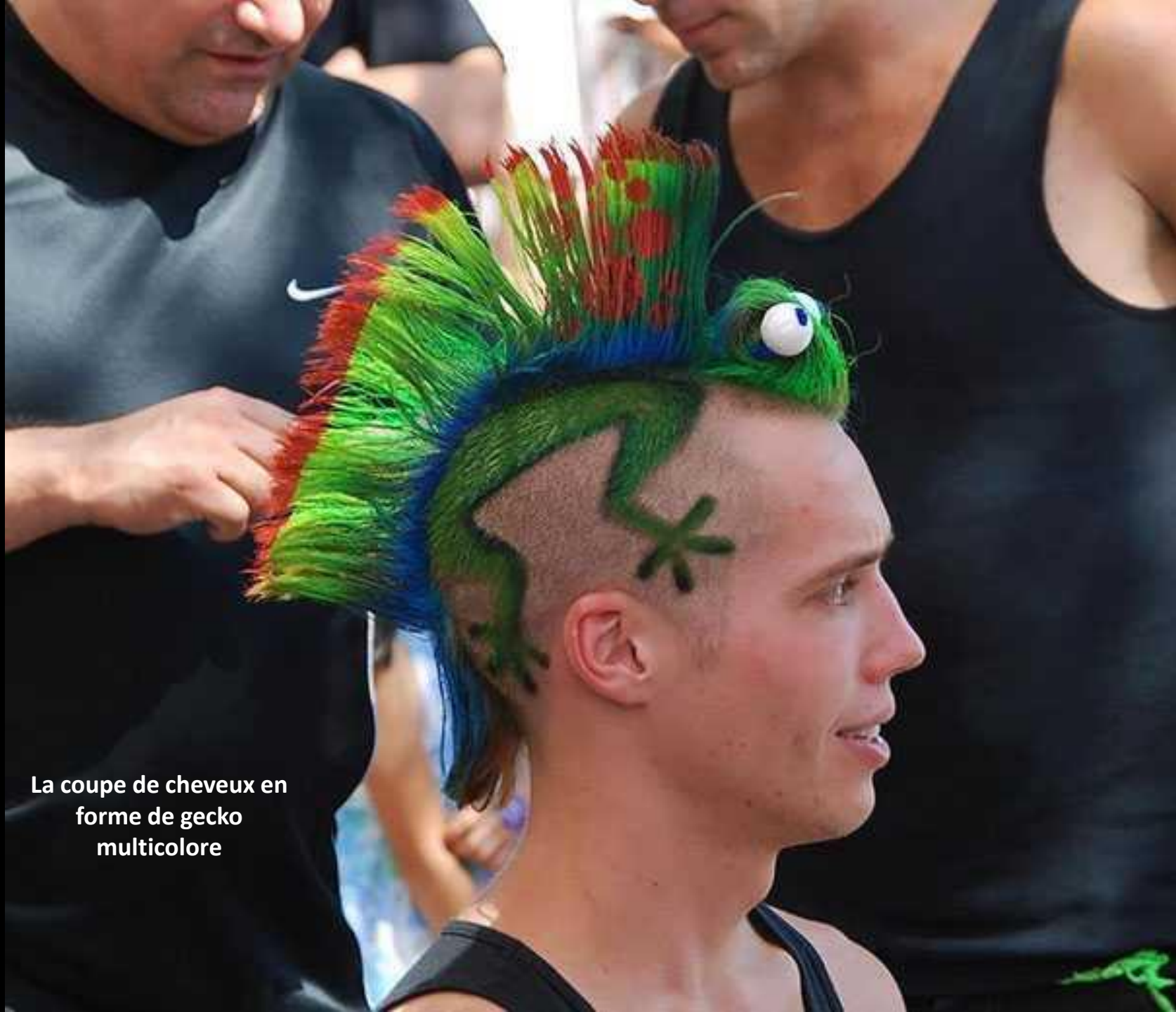
La coupe de cheveux en forme de gecko multicolore