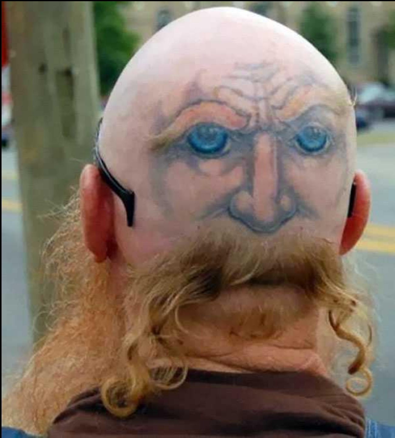
La coupe de cheveux moustache de nain (sponsorisée par Gimli)