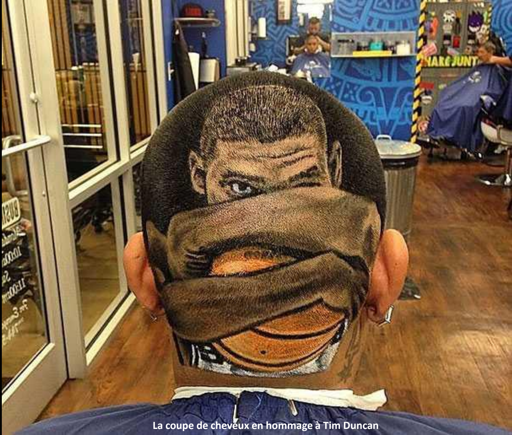
La coupe de cheveux en hommage à Tim Duncan