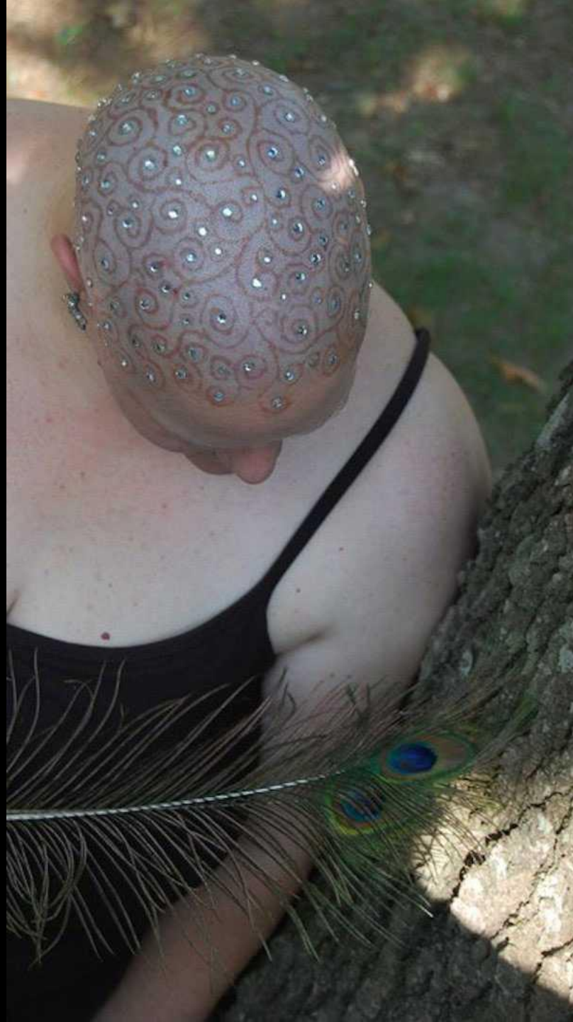
La coupe de cheveux Strass & Paillettes