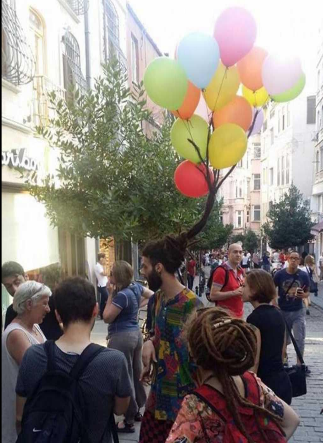
La coupe de cheveux ballons