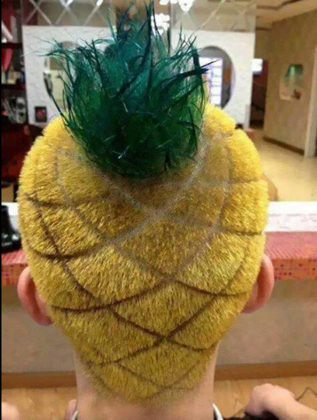
La coupe de cheveux ananas