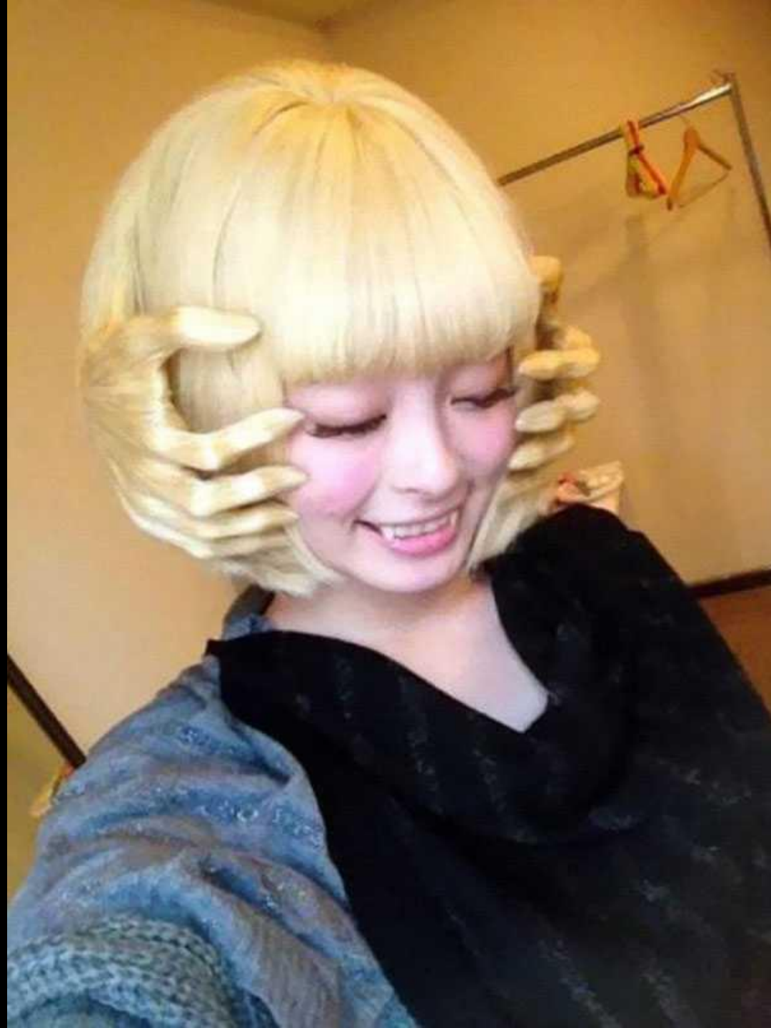
La coupe de cheveux super flippante