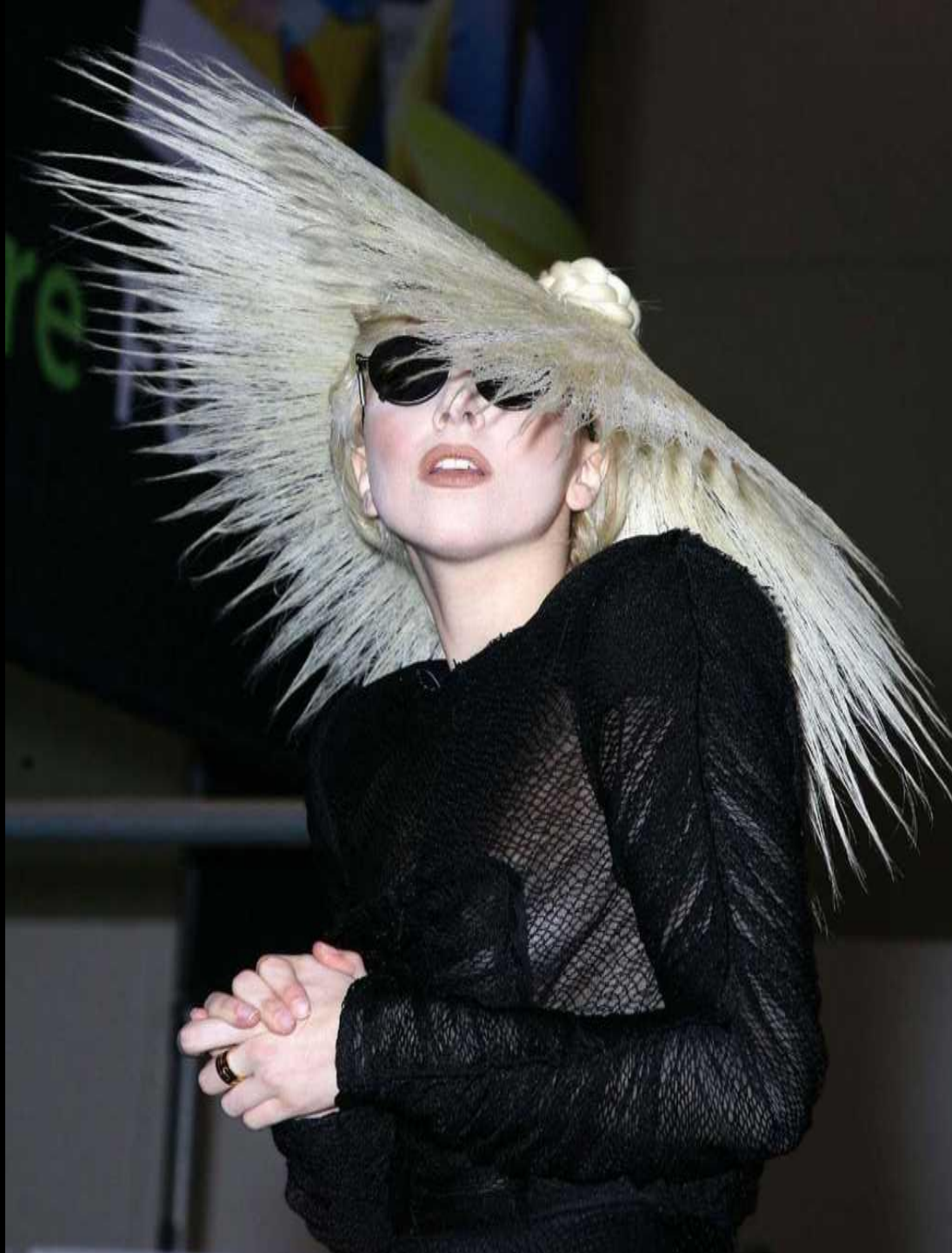
La coupe de cheveux en forme de chapeau de paille de Lady Gaga (approuvée uniquement par Lady Gaga)