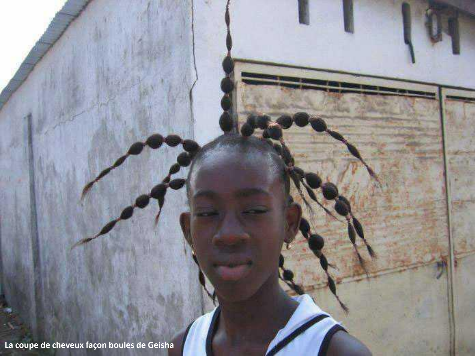
La coupe de cheveux façon boules de Geisha