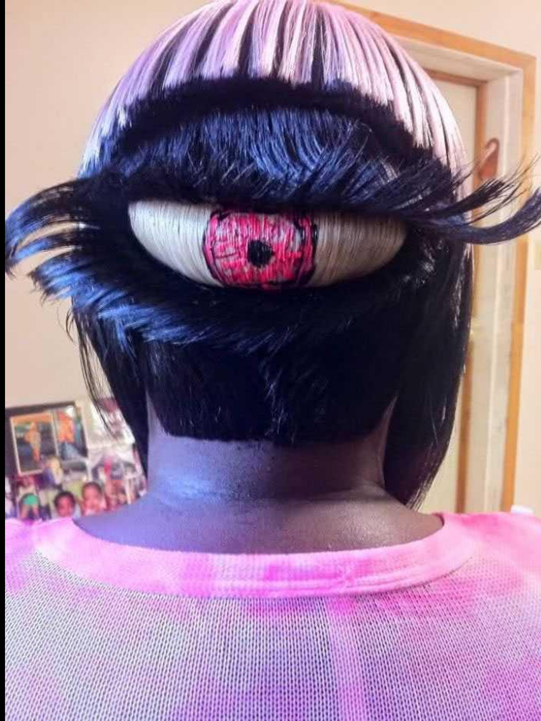
La coupe de cheveux troisième œil