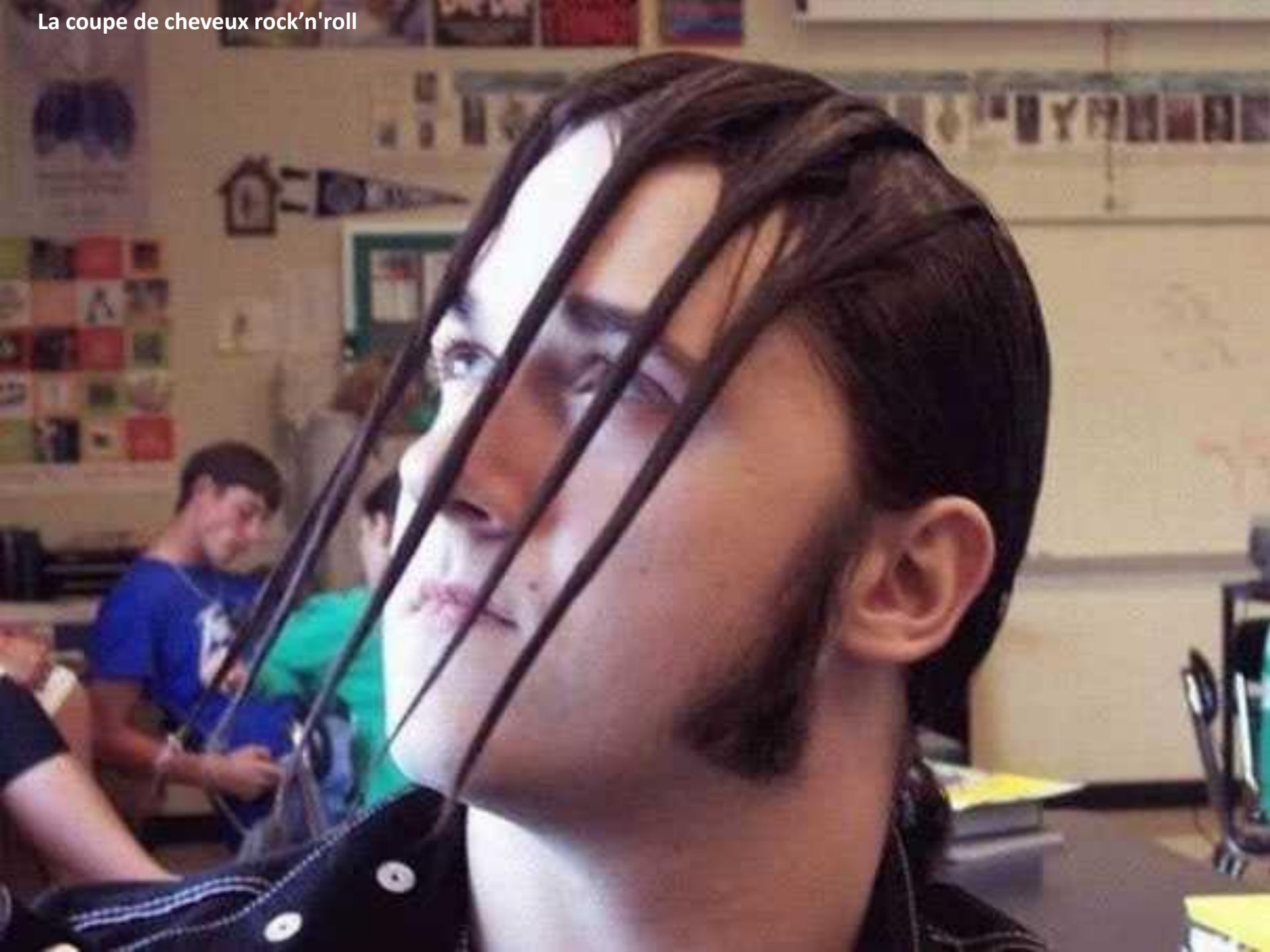
La coupe de cheveux rock'n'roll