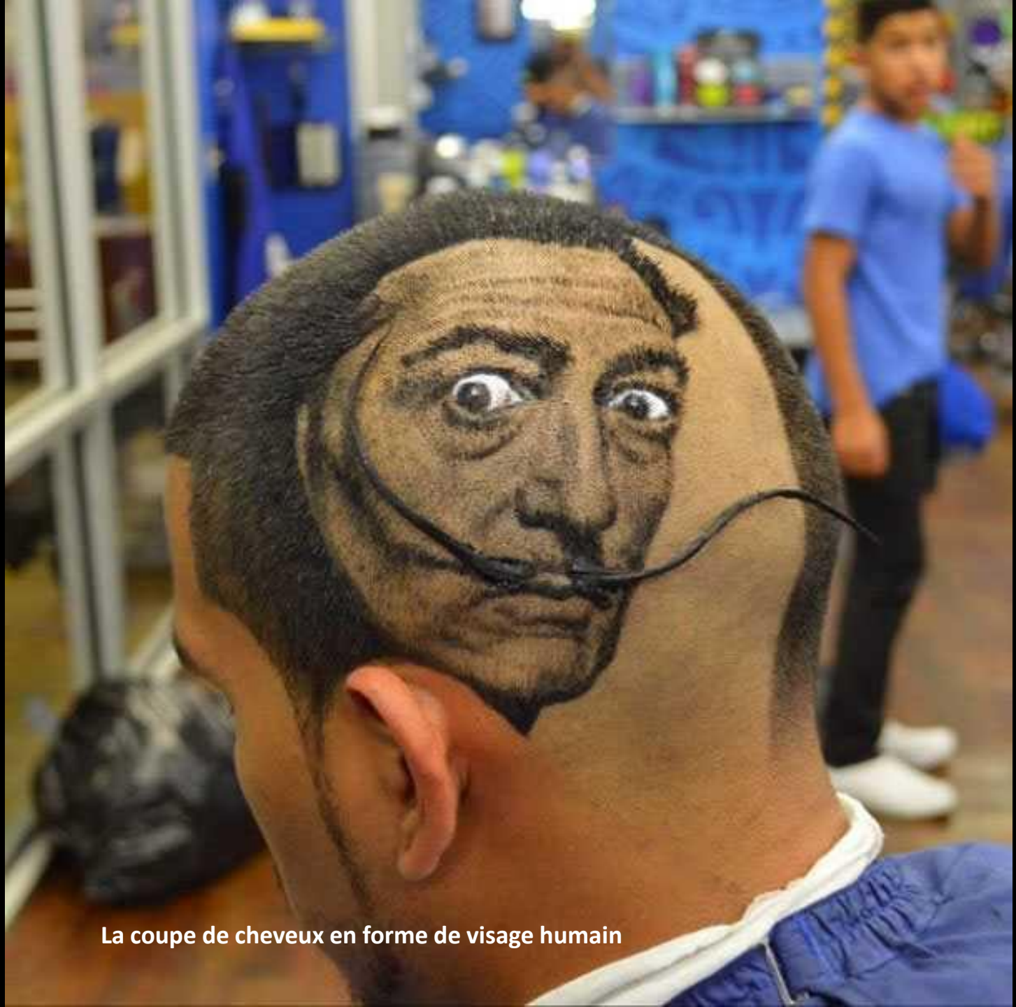
La coupe de cheveux en forme de visage humain